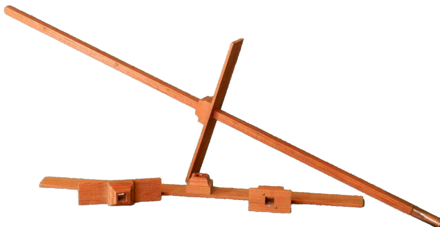
Obrázek 1: Jakubova hůl.

vzdálenosti měříš. Proužek lepenky musíš na pravítko umístit kolmo! Na stupnici pravítka pak tuto vzdálenost odečti. S tím ti mohou pomoci rodiče nebo kamarád.